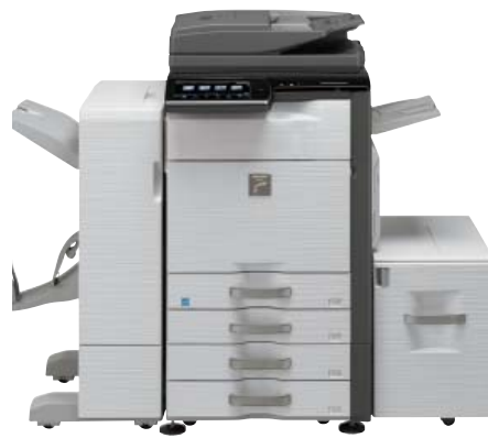
Unidad de base 1 K de acabado grapado (MX-FN10) Módulo de perforación (MX-PNX5A/C/D) Unidad de paso de papel Soporte con 2 bandejas de 500 hojas Bandeja de salida Bandeja de gran capacidad