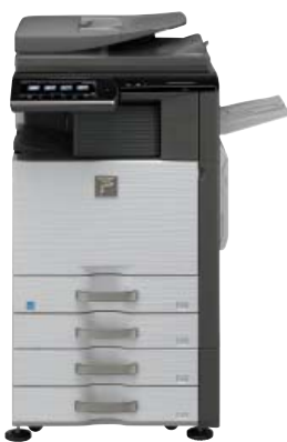
Unidad de base Acabado (MX-FNX9) Soporte con 2 bandejas de 500 hojas Bandeja de salida