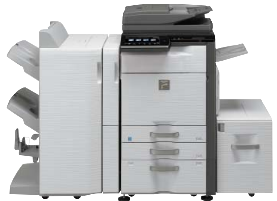
Unidad de base 4 K de acabado grapado (MX-FN18) Módulo de perforación (MX-PNX6A/C/D) Unidad de paso de papel Soporte con bandejas de 2.000 hojas Bandeja de salida Bandeja de gran capacidad