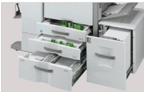
Capacidad de papel de hasta 6,600 hojas con opciones disponibles.