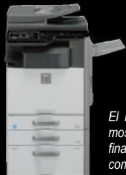
El MX-M564N mostrado con el finalizador interno compacto.

El cassette de gran capacidad disponible añade 3,500 hojas de papel carta para una capacidad en línea total de 6,600 hojas con opciones.