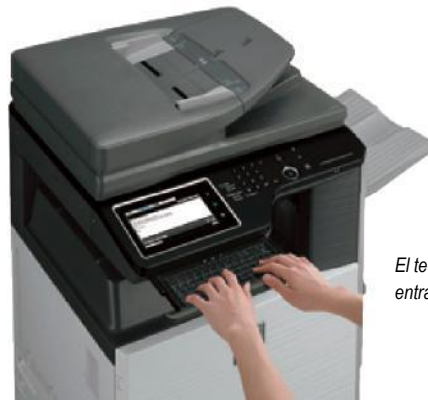
El teclado retráctil opcional simplifica la entrada de datos

Con el sistema de administración de dispositivos de Sharp, los administradores y supervisores pueden definir grupos de usuarios en el MX-M364N/M464N/M564N para administrar y restringir funciones, como copia, escaneo o impresión. Establezca fácilmente un grupo de usuarios personalizado para administrar los conteos de páginas (operaciones de copia, impresión, escaneo o fax). Esto ayuda a simplificar la administración de costos de tratamiento de imágenes. La serie MX-M364N/M464N/M564N puede almacenar perfiles hasta para 1,000 usuarios.