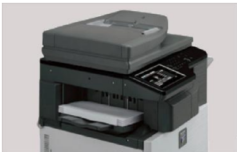
Acabador interno compacto con capacidad de engrapado de 50 hojas disponible.

Los sistemas de documentos monocromáticos MX-M364N/M464N/M564N de la serie essentials son una herramienta muy completa con valores agregados que excederán sus expectativas.