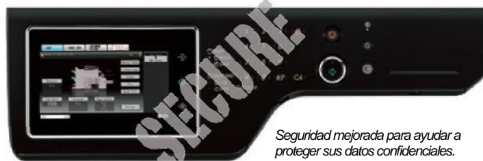
Seguridad mejorada para ayudar a proteger sus datos confidenciales.

Los modelos MX-M364N/464N/564N de la serie essentials ofrecen varias capas de seguridad estándar para proteger su negocio y la información de usuario . Las características estándar incluyen cifrado de datos, protección de sobrescritura de datos, impresión confidencial y más. Y con la conveniente función de fin de arrendamiento de Sharp, todos los datos de trabajo y datos de usuario pueden eliminarse fácilmente al momento de cambiar el equipo.