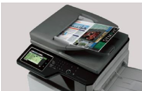
El RSPF estándar de 100 hojas escanea hasta 56 imágenes por minuto.